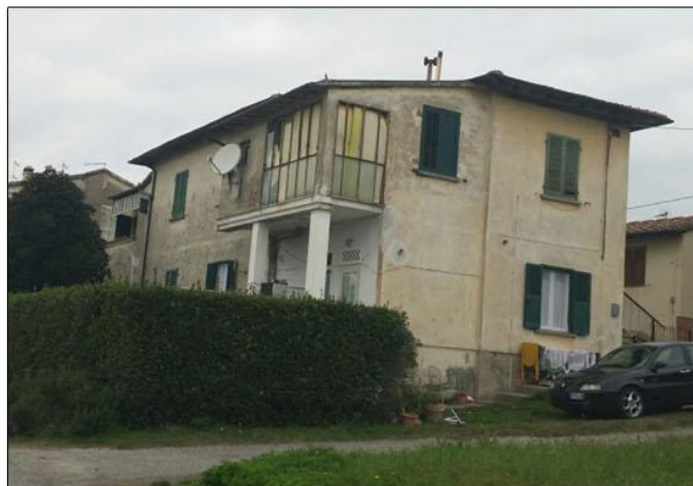
Gli immobili di Montefoscoli e Partino sui quali saranno eseguiti i lavori di ristrutturazione